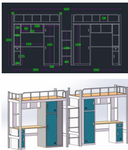
图 1 二联位上床下桌公寓床参考图