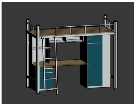
图 2 单人上床下桌公寓床参考图