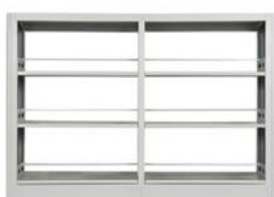
图 3 双层书架参考图