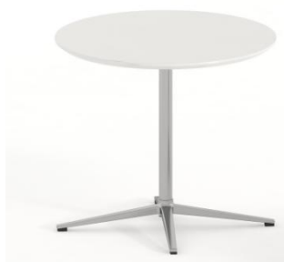
图 6 圆茶几参考图

采用铝合金支架，高度 740mm, 台面采用直径 600mm 优质岩板, 高度 740mm。