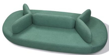
图 4 六人位沙发参考图

尺寸 2820\text{mm} \times 1300\text{mm} \times 750\text{mm} 。材质采用实木框架，面料采用环保亲肤布艺面料，耐磨耐用，座包填充严选优于行业标准的 45\text{kg}/\text{m}^3 。高密度海绵柔弹舒缓蓬松饱满，回弹好，车线流畅平整针脚细密均匀，经久耐用，底座采用钢制脚架，承重不低于 200\text{KG} 。