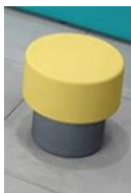
图 7 圆墩式椅子参考图

尺寸：40mm×40cm, 主体材质采用实木框架，填充物采用优质海绵，面料采用优质布亲肤艺布。