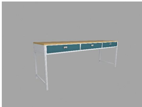
图 1 三连位学习桌参考图

板一次压制成型，横管前面宽度为 86mm，横管正面为 32mm 宽的平面，平面两端各有两条圆角加强筋，加强筋间距 10mm，横管侧面宽为 35mm，横管侧面含 R5 的圆角加强筋，桌面材料：采用 E1 级 25mm 优质环保三聚氰胺板材，双面贴三聚氰胺饰面，封边条：采用 1.5mm 厚 PVC 优质环保材料封边，环保高溶胶，永不脱落。