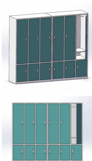
图 2 六门衣柜参考图